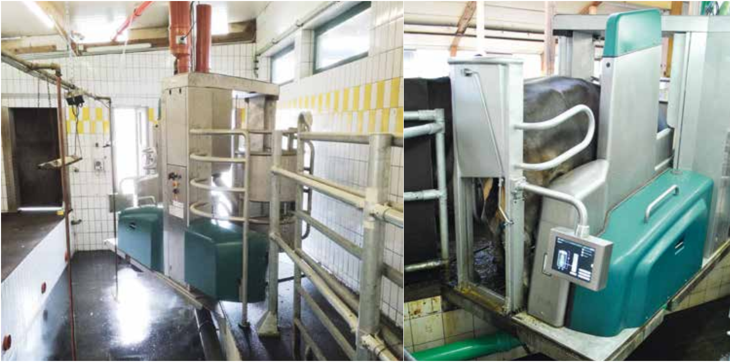
Dairy Robot R9500 als Podest-Lösung im bestehenden Melkstand

Die Kuhherde gesund zu halten, wird dadurch wesentlich einfacher! All diese Faktoren zusammen tragen wiederum zu einer höheren Betriebseffizienz bei. Dazu kommt, dass der GEA DairyRobot R9500 dank seiner Flexibilität optimal in bestehende Stallstrukturen integriert werden kann. So werden weitere Kosten eingespart, die früher noch für den Bau eines neuen Stalls oder einen Umbau angefallen wären.