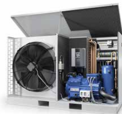
Kälteaggregat GEA Plusbox

Schuler Landtechnik GmbH & Co. KG 79274 St. Märgen www.schuler-landtechnik.de