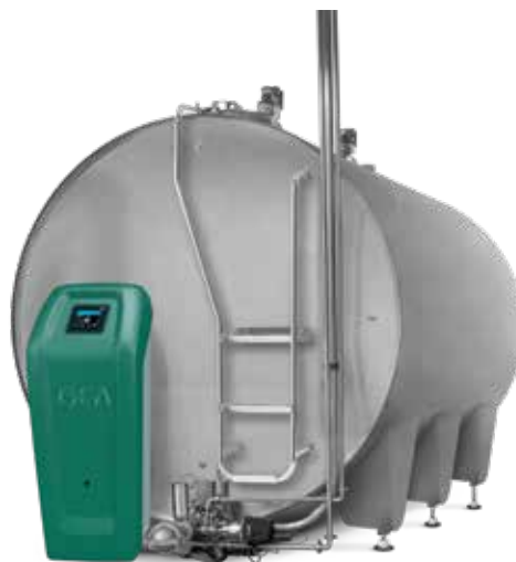
Tanksteuerung GEA ICool

Mit der Plusbox hat GEA nun ein energieeffizientes Kälteaggregat für die Milcherzeugung im Angebot, das sich in anderen Bereichen der GEA Welt bereits bewährt hat. Nun kann sie auch in die GEA Kühltanks TCool, VCool sowie die Tanks anderer Anbieter integriert werden. Der besondere Vorteil: Dank Frequenzregelung passt sich die Kühlkapazität dem jeweiligen Kühlbedarf an. Dadurch ist die kompakte Plusbox vor allem für geringen Milchfluss beim automatischen Melken geeignet. Und das alles unter Aufwendung vergleichsweise geringer Energiemengen. Abgerundet wird ihr Leistungsspektrum durch eine besonders gute Dämmung, die für einen geräuscharmen Betrieb sorgt. Das schont einerseits die geräuschempfindlichen Ohren der Tiere und stört andererseits nicht die Ruhe der Nachbarn.