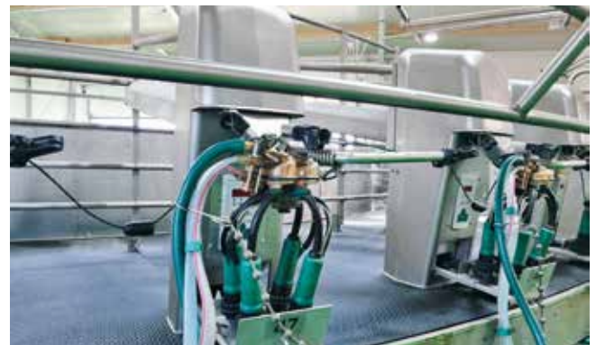
Automatisches Dippen mit dem GEA Apollo Melkzeug für den perfekten Betriebsablauf

HAWART OMV 17033 Neubrandenburg-Weitin www.hawartomv.de