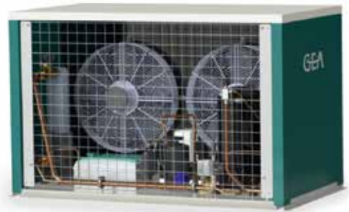
Sofortkühlösung DairyCool C5430

Der neue modulare Chiller DairyCool C5430 von GEA ist eine Sofortkühlung, die im Stand-alone-Betrieb arbeitet oder als zusätzliche Kühlleistungsquelle eingesetzt werden kann. Sie wird direkt vor dem Tank installiert und sorgt dort stets für kühl temperierte Milch. Speziell für Milchbetriebe entwickelt, ist der Chiller in kleinen Leistungsgrößen erhältlich. Dadurch dass er modular installiert werden kann, ist er für alle Betriebsgrößen nutzbar. Je nach Bedarf können pro Steuerung bis zu sechs Module betrieben werden. Dies macht ihn zum echten Effizienzwunder im Stall, das obendrein mit den Ansprüchen wächst.